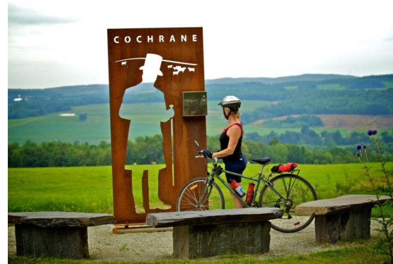
Source : Voie des Pionniers sur le chemin de Cochrane, Compton (M. Stéphane Lafrance)